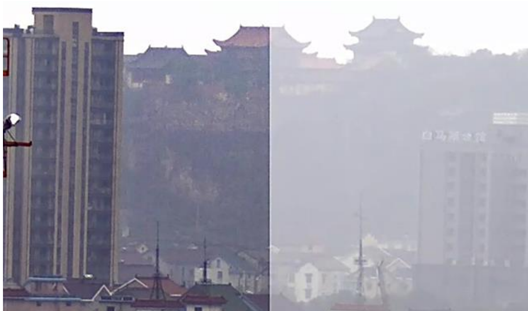
Рисунок 2 А Сравнение «до» и «после» улучшения коэффициента контрастности