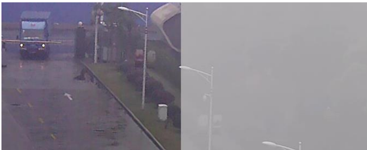
Рисунок 3 А Сравнение деталей до и после улучшения