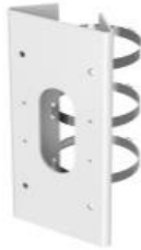
DS-1276ZI-SUS Крепление на столб