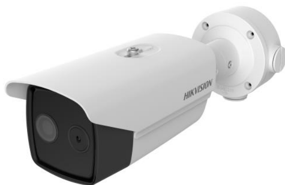
Рисунок 2 – Общий вид оптоэлектронного блока, входящего в состав комплексов моделей DS-2TD2636B-10/P, DS-2TD2636B-13/P, DS-2TD2636B-15/P, DS-2TD2637B-10/P, DS-2TD2617B-6/PA, DS-2TD2617B-3/PA