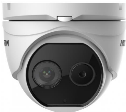
Рисунок 1 – Общий вид оптоэлектронного блока, входящего в состав комплексов моделей DS-2TD1217B-3/PA, DS-2TD1217B-6/PA

Фотографии общего вида компонентов комплексов тепловизионного контроля измерительных стационарных серии DS-2TD приведены на рисунках 1-3. Структура системы представлена на рисунке 4.