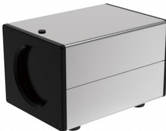
Рисунок 3 – Общий вид АЧТ